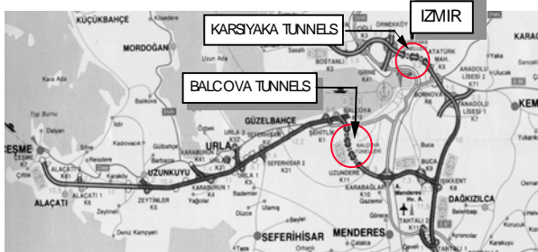
SILNIČNÍ OBCHVAT MĚSTA IZMIR – UMÍSTĚNÍ TUNELŮ